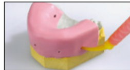
GI-MASK Automix New Formula injizieren.

Isolation of the silicone matrix key using GI-MASK Universal Separator.