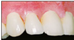
Restauration auf dem Modell.