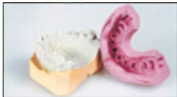
Arbeitsmodell mit Lab-Putty Schlüssel.

Unsectioned model with Lab-Putty impression.