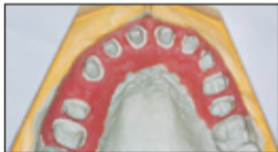
Fertiges Modell mit GI-MASK Automix New Formula.

Injection of GI-MASK Automix New Formula.