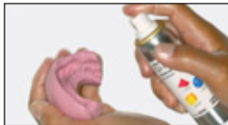
Silikonschlüssel mit GI-MASK Universal Separator isolieren.

Unsectioned model with Lab-Putty impression.